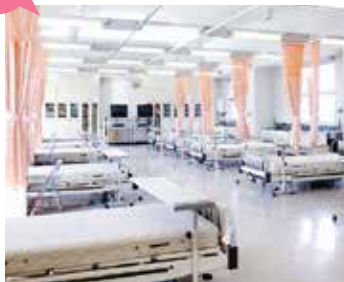
3階 基礎看護実習室