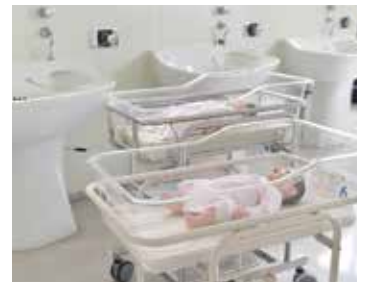
3階 小児・母性看護実習室