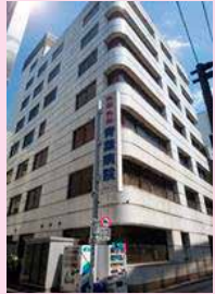
青葉病院 〒154-0004 世田谷区太子堂2-15-2 TEL 03-3419-7111